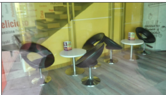
Fotografía 2 Área donde está la boca del pozo pz-02-0002, cubierta por placa en concreto y baldosa