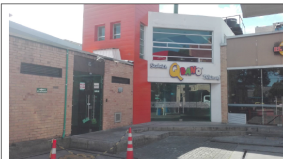
Fotografía 1 Local comercial donde se ubica el pozo pz-02-0002.

Teniendo en cuenta las características de dicha captación que es saltante y que se desconoce las condiciones técnicas y ambientales, se solicitará al grupo jurídico ordenar las actividades pertinentes a liberar la boca del pozo pz-02-0002 y ordenar el sellamiento definitivo del mismo cumpliendo con los lineamientos técnicos establecidos.